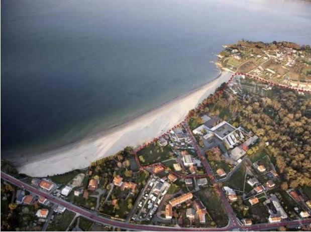
Ilustración 2 vista aérea playa de Gandarío