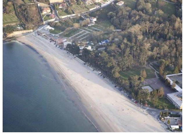
Ilustración 1 vista aérea playa de Gandarío

Con el objeto de cumplir con las medidas de prevención de contagio de la COVID-19, es importante definir los espacios teniendo en cuenta que los tránsitos no pongan en riesgo las medidas de seguridad. Toda el área de competición solo será accesible para el personal debidamente acreditado (socorristas, delegados, personal de organización, equipo arbitral)