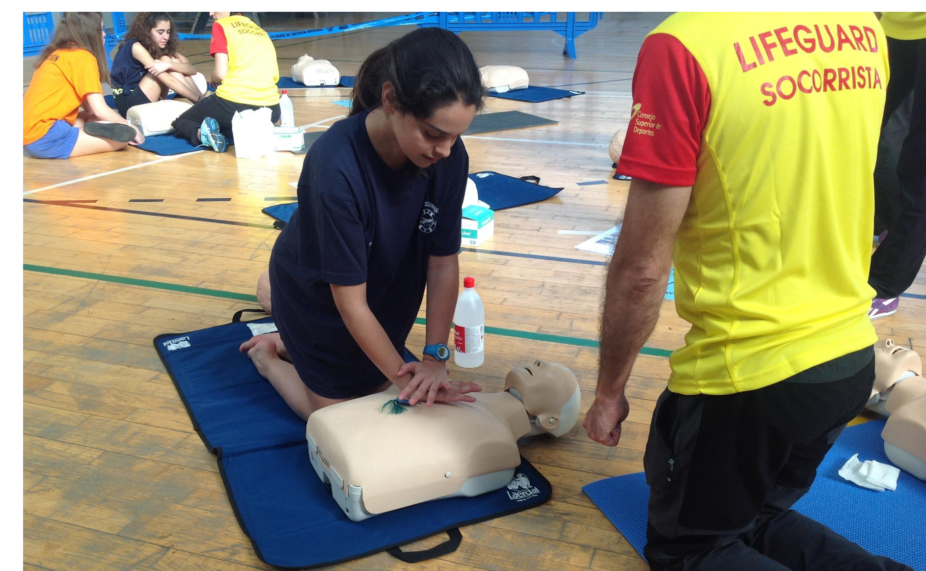
Actividades de prevención y formación realizadas por la RFESS en función de la edad a las que se dirigen